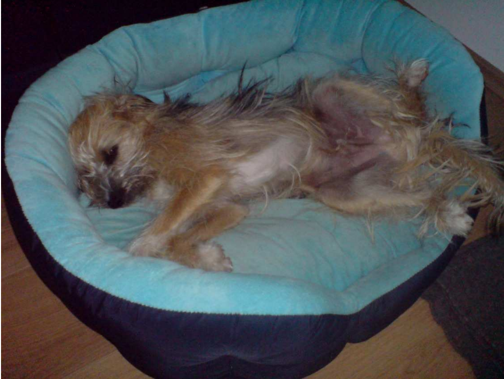
Im Körbchen zu