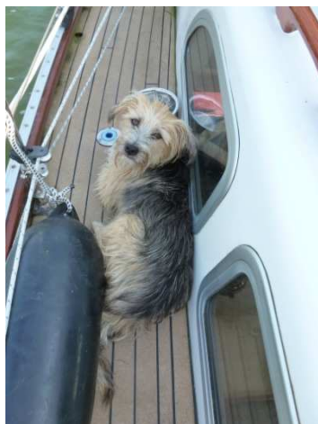
Nochmal beim segeln